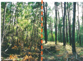
forêt de pin maritime non entretenue