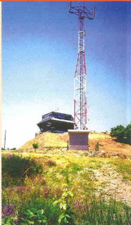
Pendant la période estivale, les tours de guet sont activées

(tours de guet, surveillance aérienne, patrouilles terrestres), des équipements spécifiques (pistes forestières et réserves d'eau), et l'intervention rapide (Sapeurs Pompiers) qui permettent de réduire les surfaces incendiées en cas de départ de feu.