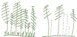
La structure de peuplement forestier présentant le moins de risque au feu sera une futaie éclaircie et élaguée.

En courant sur un sol dégagé, le feu passera ainsi plus vite et ne se propagera pas en cime, causant moins de dégâts aux grands arbres, protégés par leur écorce. De plus, une futaie composée d'un mélange d'essences est moins sensible au feu.