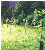
Mosaïque de plantation feuillue.