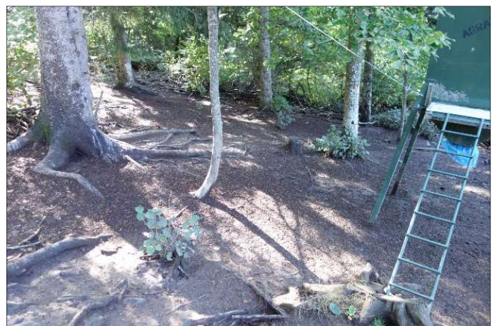
Les possibilités d'agrainage seront limitées

Le programme d'accompagnement de PEFC AURA en lien avec les structures de la filière bois aidera chacun dans ses démarches.