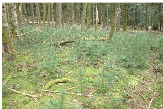
Semis de douglas dans sapinière