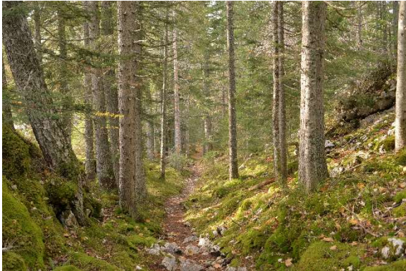
RBI du Vercors

Le standard à venir souhaite impliquer pleinement le propriétaire forestier, amené à réaliser différents diagnostics sur ses forêts. Parmi ceux-ci, il est invité à « identifier et prendre en compte les zones forestières de haute valeur écologique » présentes sur sa propriété. Identifier pour mieux protéger des zones qui sont en partie définies réglementairement. Peu