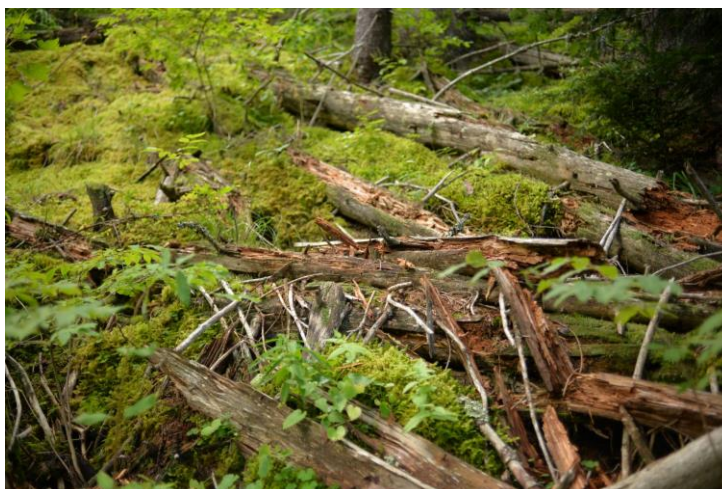
Les branches disposées au sol assurent une meilleure décomposition